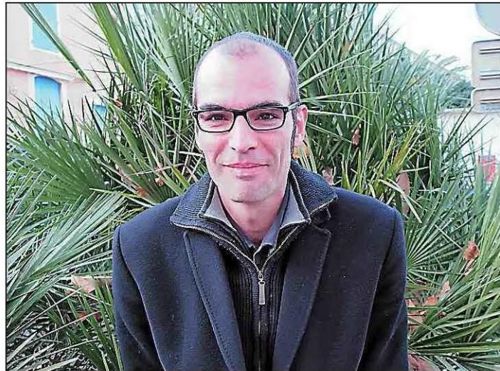
■ Le comédien et metteur en scène de la Compagnie Nocturne.